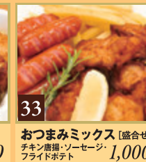
33 おつまみミックス [盛合せ] チキン唐揚げ・ソーセージ・ フライドポテト 1,000