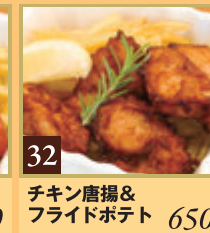
32 チキン唐揚げ& フライドポテト 650