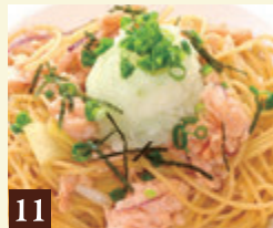
11 和風ソース しゃきしゃき鬼おろしと スモークサーモン 1,250