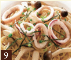
9 和風ソース イカときのこと明太子 1,200