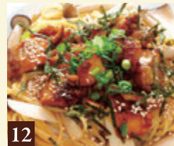
12 和風ソース 照焼チキンときのこ 1,050