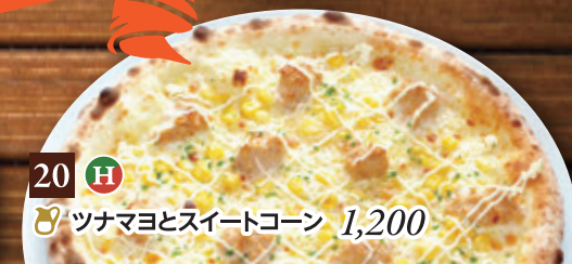
20 H 🍷 ツナマヨとスイートコーン 1,200

21 Half & Half 人気ピッツァの ハーブ&ハーブ 1,450 1枚で2種類楽しめる欲張りメニューです!! H印のついたピッツァメニューより お好きな2品をお選びください。 ★マルゲリータ ★4種のチーズとはちみつ ★照焼チキン ★ツナマヨとスイートコーン