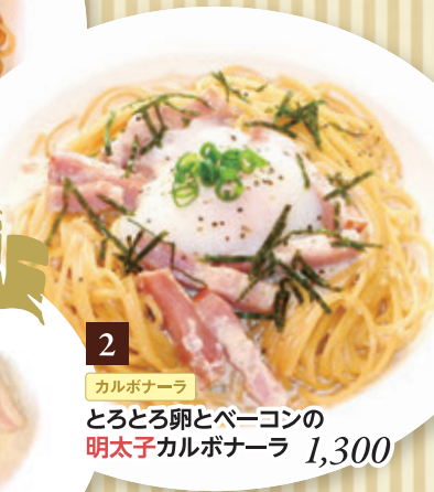
2 カルボナーラ とろとろ卵とベーコンの 明太子カルボナーラ 1,300