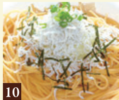
10 和風ソース しゃきしゃき鬼おろしと ちりめんしらす 1,150