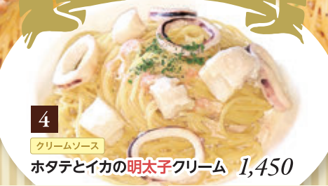
4 クリームソース ホタテとイカの明太子クリーム 1,450