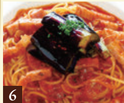
6 トマトソース なすとベーコン 1,200