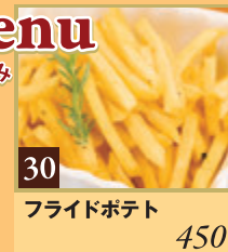
30 フライドポテト 450