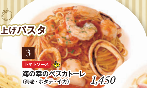
3 トマトソース 海の幸のペスカトーレ (海老・ホタテ・イカ) 1,450