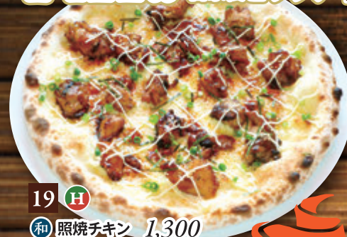
19 H 和 照焼チキン 1,300