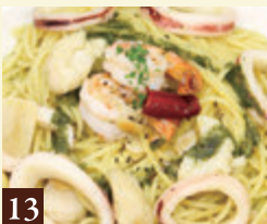
13 バジルソース 海の幸のジェノベーゼ 1,450