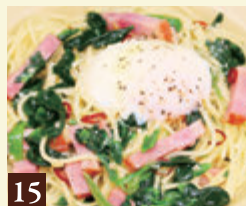
15 ベベロンチーノ とろとろ卵とベーコンの ベベロンチーノ 1,050