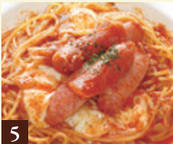
5 トマトソース あらびきソーセージと モッツアレラ 1,200