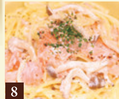
8 クリームソース スモークサーモンときのこの クリームソース 1,350