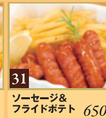
31 ソーセージ& フライドポテト 650