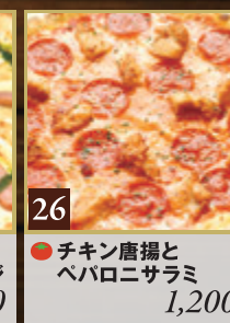
26 ● チキン唐揚げと ペパロニサラミ 1,200