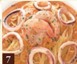
7 トマトクリームソース 海老とイカのピンクソース 1,300