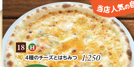
18 H 🍷 4種のチーズとはちみつ 1,250