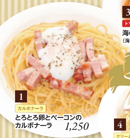
1 カルボナーラ とろとろ卵とベーコンの カルボナーラ 1,250