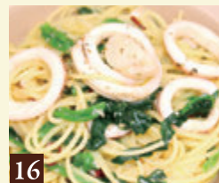
16 ベベロンチーノ ホタテとイカの 明太子ベベロンチーノ 1,350

🔥 にんにく入り 🌿 にんにく、とうがらし入り ★にんにく、とうがらしの量は好みに応じて。