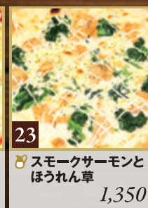
23 🍷 スモークサーモンと ほうれん草 1,350