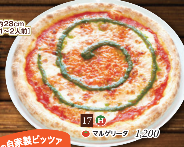
17 H ● マルゲリータ 1,200