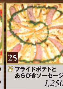
25 🍷 フライドポテトと あらびきソーセージ 1,250