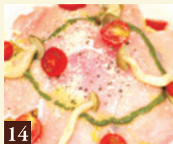
14 バジルソース 生ハム・フレッシュトマトと きのこのジェノベーゼ 1,400