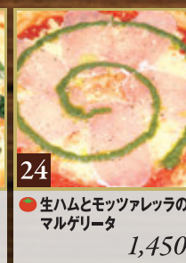
24 ● 生ハムとモッツアレラの マルゲリータ 1,450