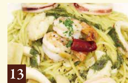
13 バジルソース 海の幸のジェノベーゼ 1,500(税込1,650)