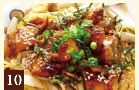
10 和風ソース 照焼チキンときのこと 1,228(税込1,350)