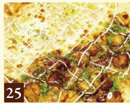
25 和 照焼チキン + ツナマヨとスイートコーン 1,455(税込1,600)