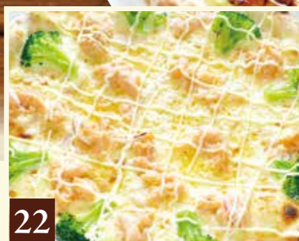
22 スモークサーモンとブロッコリー 1,455(税込1,600)