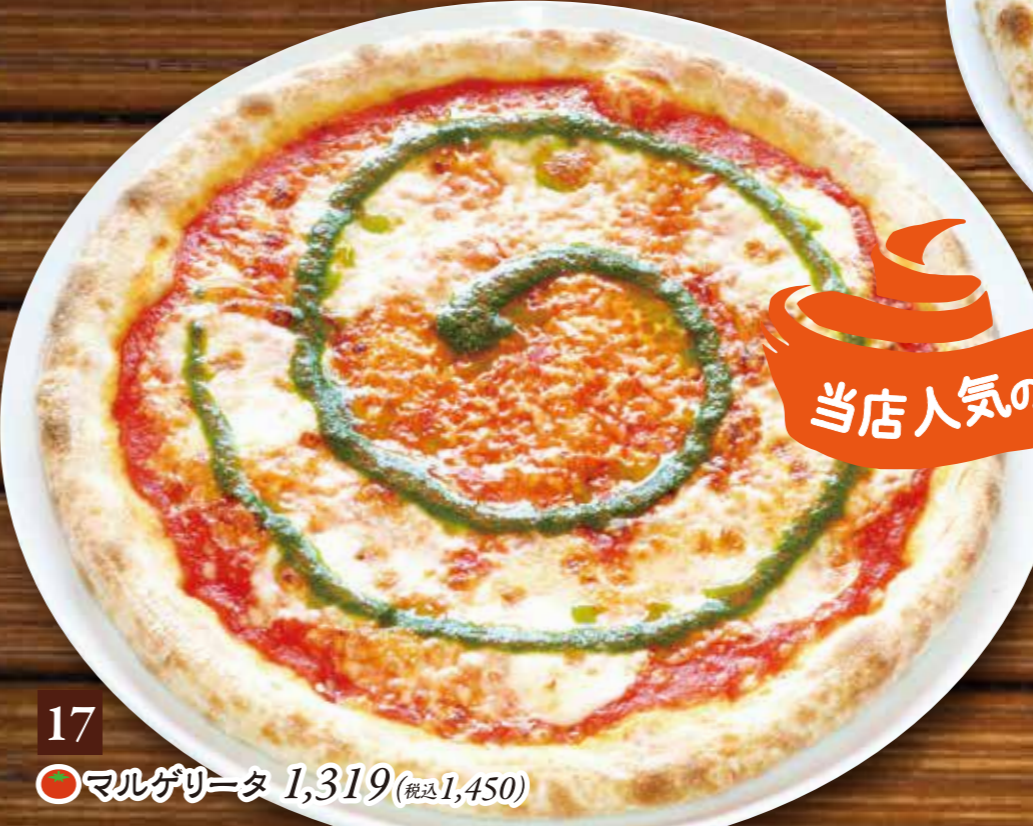
17 マルゲリータ 1,319(税込1,450)