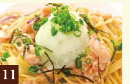
11 和風ソース スモークサーモンと大根おろし 1,319(税込1,450)