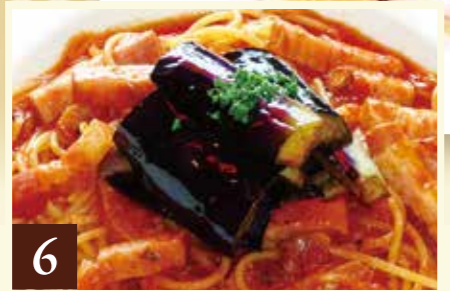
6 トマトソース なすとベーコン 1,319(税込1,450)