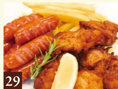
チキン唐揚げ&フライドポテト