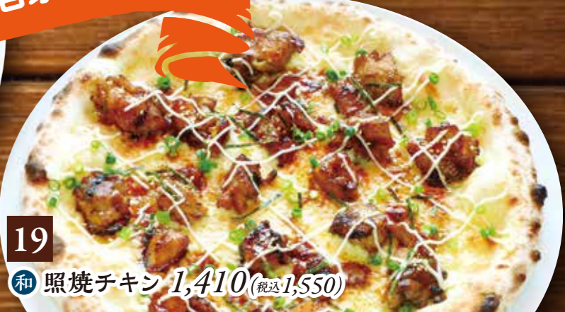
19 和 照焼チキン 1,410(税込1,550)