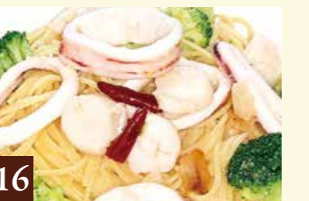
16 ペペロンチーノ ホタテとイカの明太子ペペロンチーノ 1,410(税込1,550)

🔥 にんにく入り 🌶️ にんにく、とうがらし入り ★にんにく、とうがらしの量はお好みに応じます。