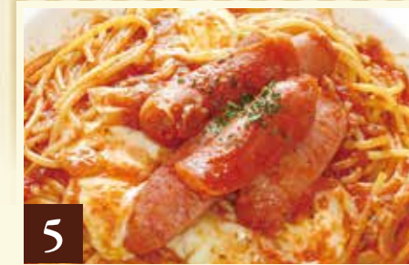
5 トマトソース ソーセージとモッツアレラ 1,319(税込1,450)