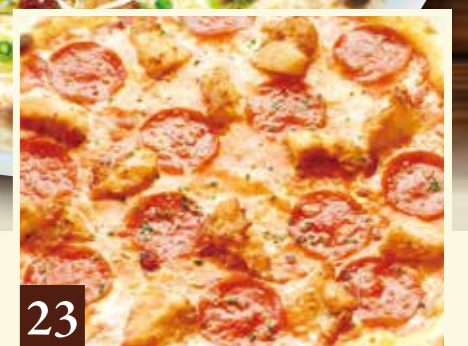
23 チキン唐揚げとペパロニサラミ 1,319(税込1,450)