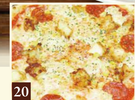
20 ハッピーミックス 唐揚げ・ペパロニ・ツナマヨ・コーン 1,455(税込1,600)