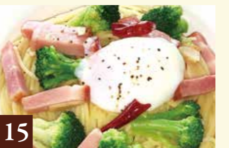
15 ペペロンチーノ とろとろ卵とベーコンのペペロンチーノ 1,228(税込1,350)