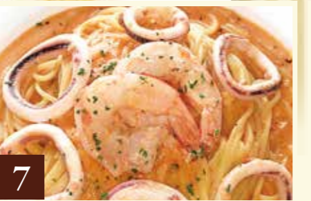
7 トマトクリームソース 海老とイカのピンクソース 1,410(税込1,550)