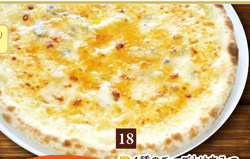
18 4種のチーズとはちみつ 1,364(税込1,500)