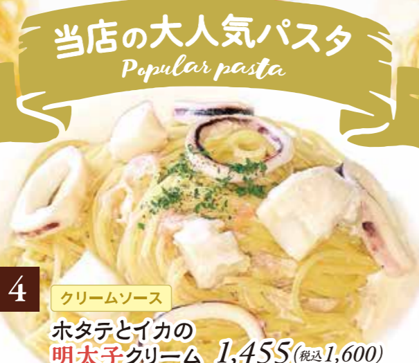
4 クリームソース ホタテとイカの明太子クリーム 1,455(税込1,600)