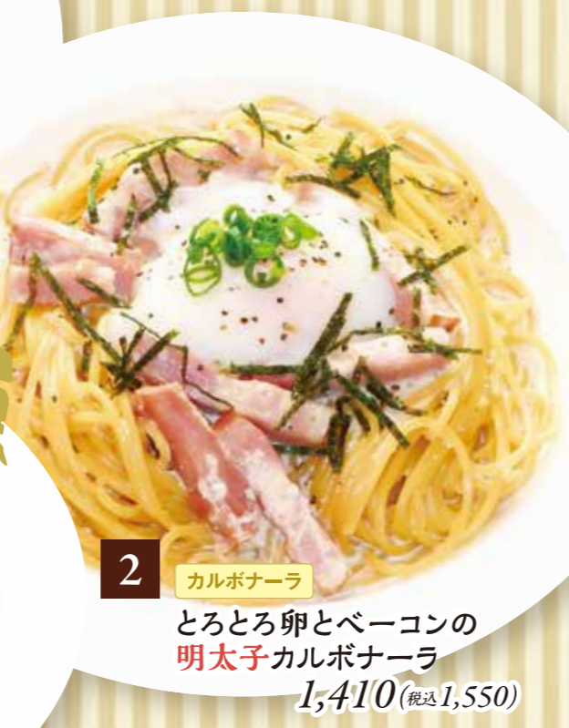
2 カルボナーラ とろとろ卵とベーコンの明太子カルボナーラ 1,410(税込1,550)