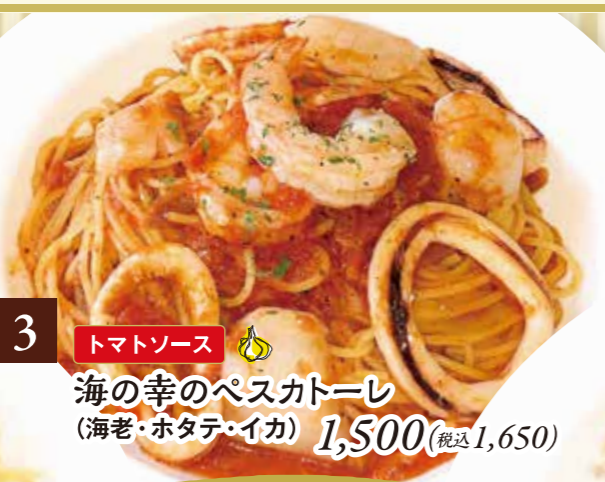
3 トマトソース 海の幸のペスカトーレ (海老・ホタテ・イカ) 1,500(税込1,650)