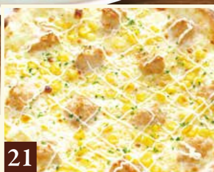
21 ツナマヨとスイートコーン 1,319(税込1,450)