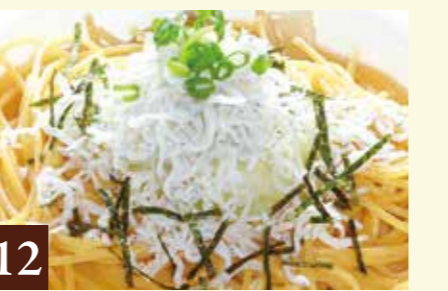
12 和風ソース ちりめんしらすと大根おろし 1,228(税込1,350)