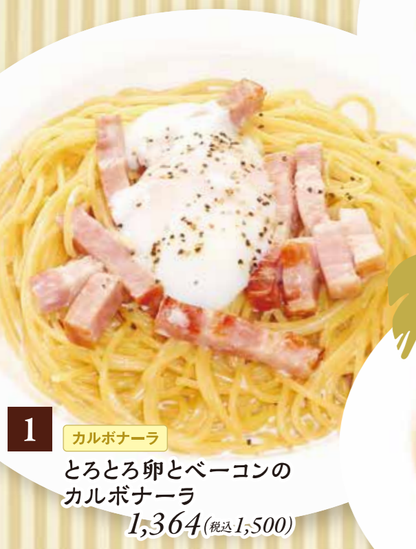
1 カルボナーラ とろとろ卵とベーコンのカルボナーラ 1,364(税込1,500)