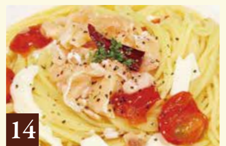
14 ペペロンチーノ スモークサーモン・トマトとモッツアレラのペペロンチーノ 1,410(税込1,550)