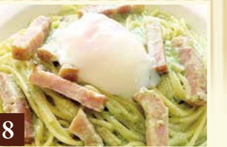
8 カルボナーラ とろとろ卵とベーコンのジェノベーナ 1,410(税込1,550)