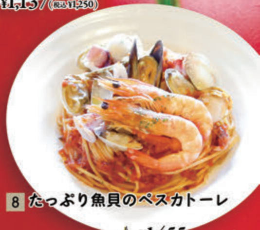
8 たっぷり魚貝のペスカトーレ