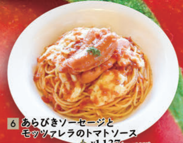
6 あらびきソーセージとモッツアレラのトマトソース