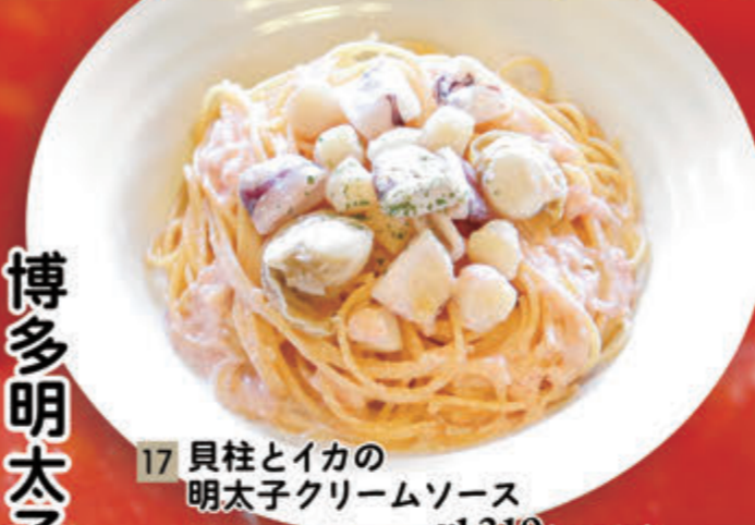
17 貝柱とイカの 明太子クリームソース ¥1,319(税込¥1,450)