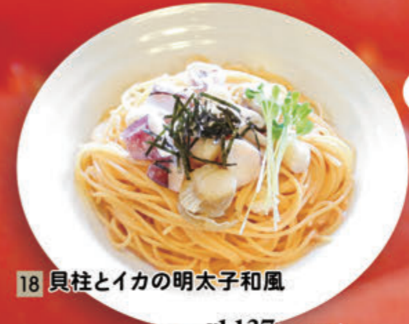
18 貝柱とイカの明太子和風 ¥1,137(税込¥1,250)