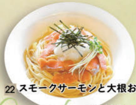
22 スモークサーモンと大根おろし ¥1,137(税込¥1,250)