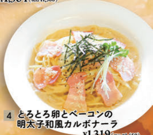
4 とろとろ卵とベーコンの明太子和風カルボナーラ