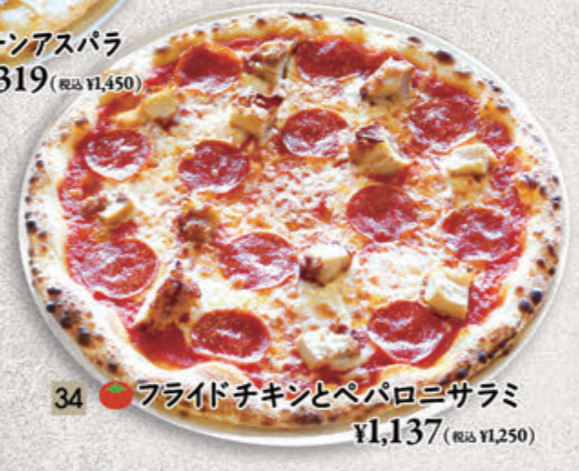
34 ● フライドチキンとペパロニサラミ ¥1,137(税込 ¥1,250)