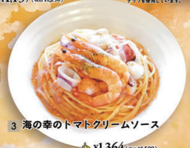
3 海の幸のトマトクリームソース