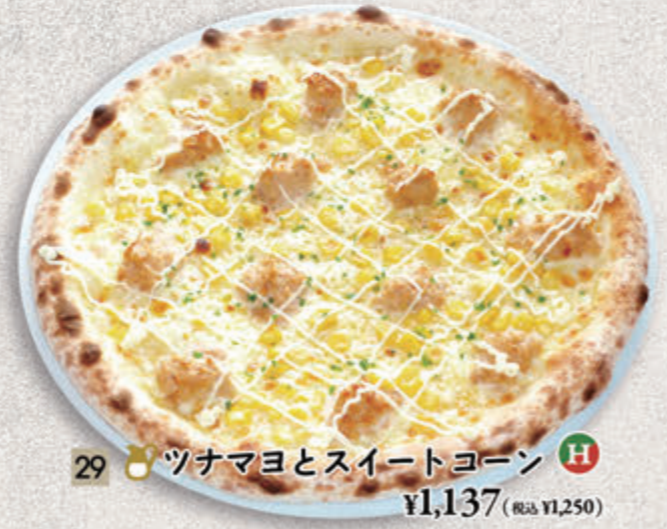
29 ● ツナマヨとスイートコーン H ¥1,137(税込 ¥1,250)