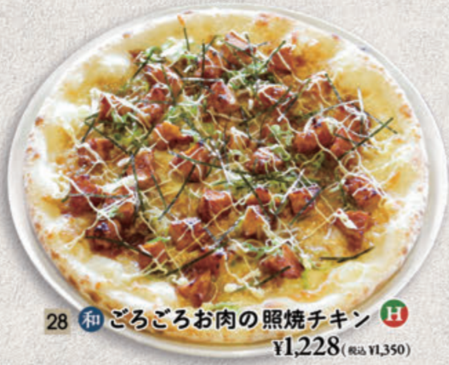
28 ● 和 ごろごろお肉の照焼チキン H ¥1,228(税込 ¥1,350)