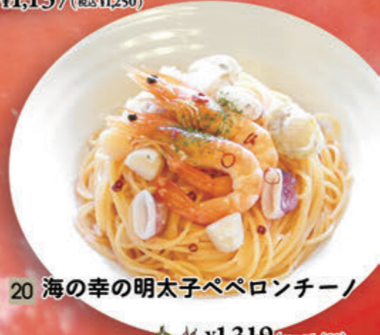
20 海の幸の明太子ペペロンチーノ ¥1,319(税込¥1,450)