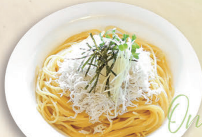
21 釜揚げしらすと大根おろし ¥955(税込¥1,050)