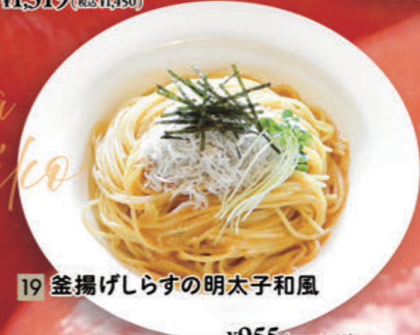
19 釜揚げしらすの明太子和風 ¥955(税込¥1,050)