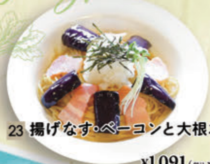
23 揚げなす・ベーコンと大根おろし ¥1,091(税込¥1,200)