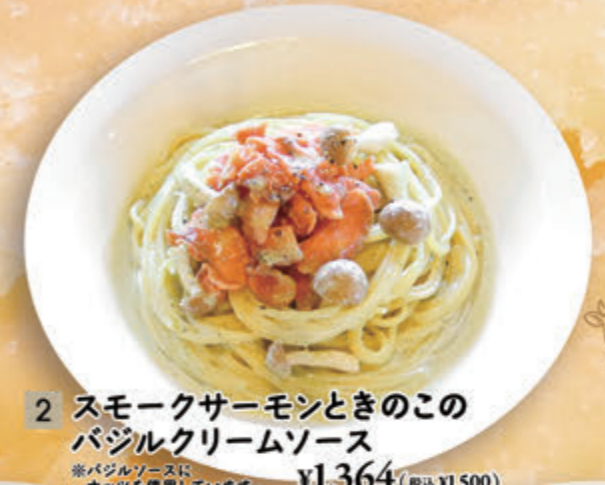
2 スモークサーモンときのこのバジルクリームソース