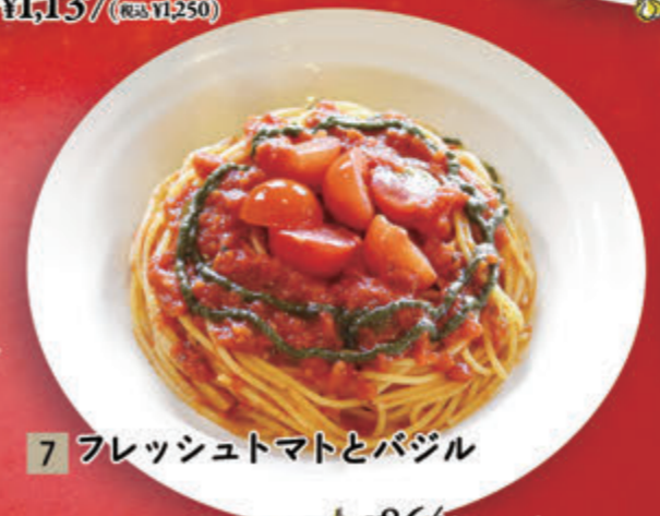
7 フレッシュトマトとバジル