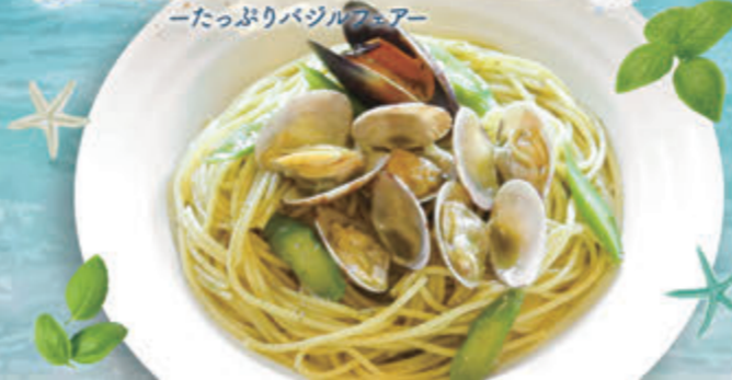
24 あさりとムール貝の ボンゴレ和風ジェノベーゼ ¥1,273(税込¥1,400)