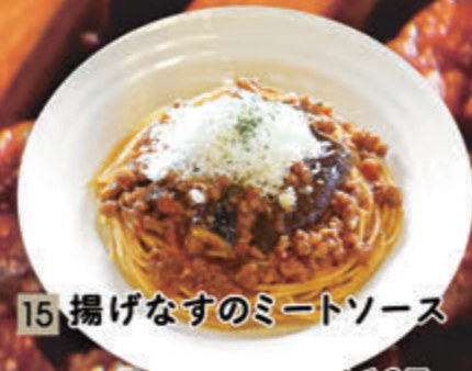
15 揚げなすのミートソース ¥1,137(税込¥1,250)