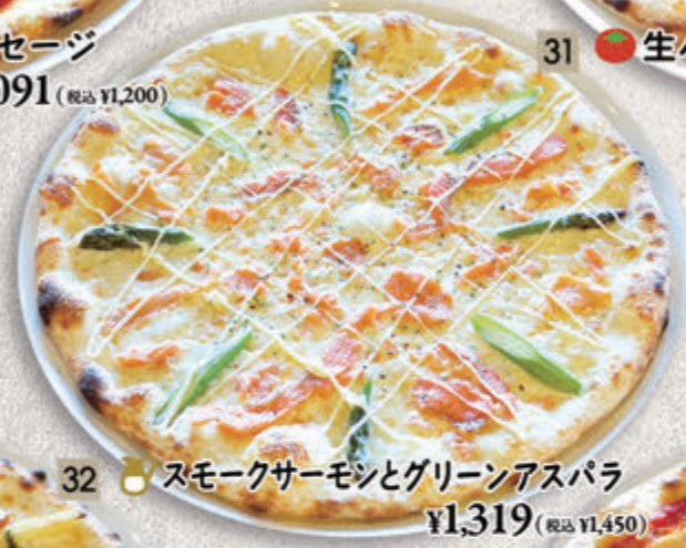
32 ● スモークサーモンとグリーンアスパラ ¥1,319(税込 ¥1,450)