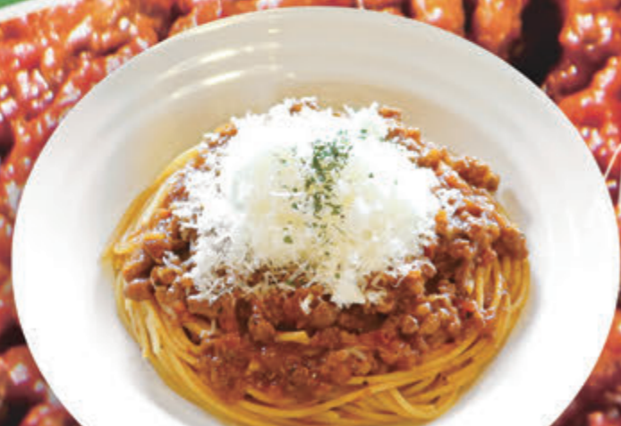
14 ふわふわチーズのミートソース ¥1,137(税込¥1,250)