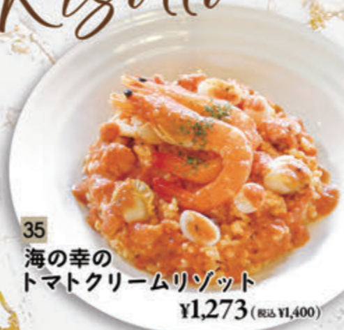
35 海の幸の トマトクリームリゾット ¥1,273(税込 ¥1,400)