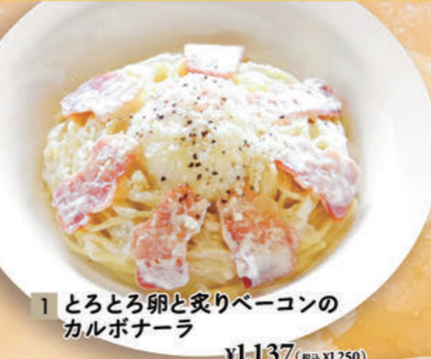
1 とろとろ卵と炙りベーコンのカルボナーラ