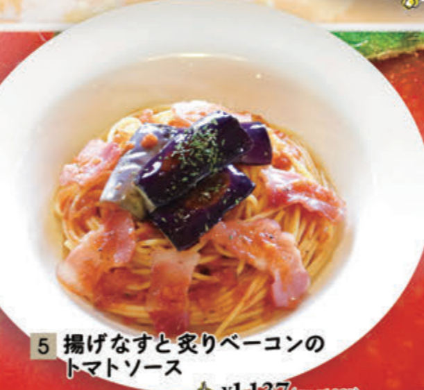
5 揚げなすと炙りベーコンのトマトソース