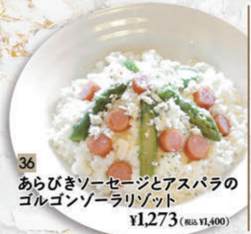
36 あらびきソーセージとアスパラの ゴルゴンゾーラリゾット ¥1,273(税込 ¥1,400)