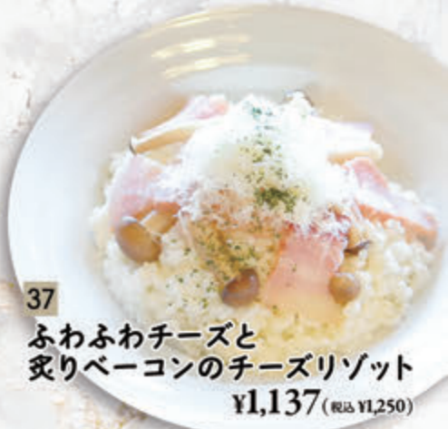
37 ふわふわチーズと 炙りベーコンのチーズリゾット ¥1,137(税込 ¥1,250)