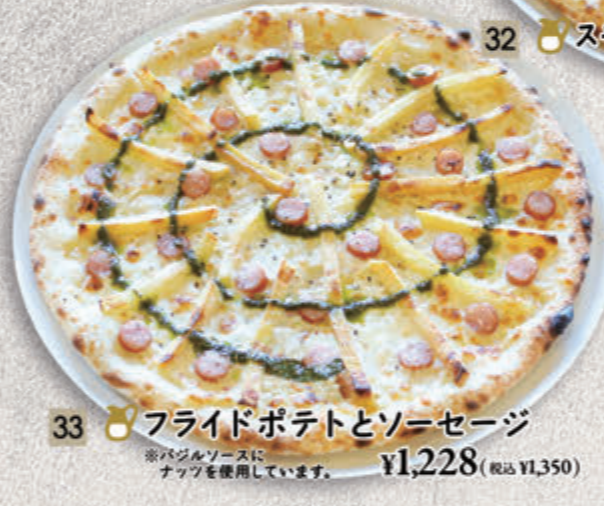
33 ● フライドポテトとソーセージ ※バジルソースにナッツを使用しています。 ¥1,228(税込 ¥1,350)