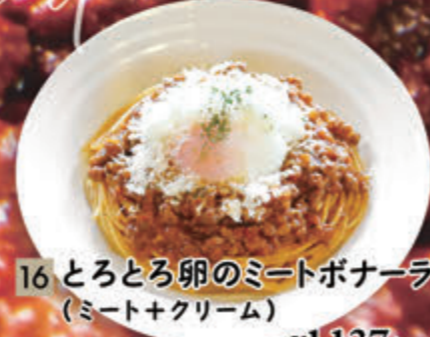
16 とろとろ卵のミートボナーラ (ミート+クリーム) ¥1,137(税込¥1,250)