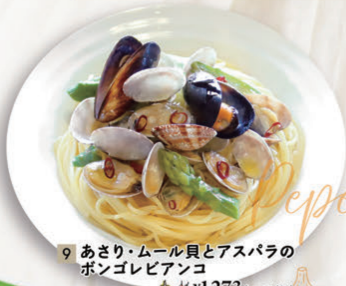
9 あさり・ムール貝とアスパラの ボンゴレビアンコ ¥1,273(税込¥1,400)