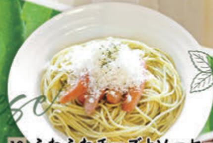
13 ふわふわチーズとソーセージの ジェノベーゼ ¥1,137(税込¥1,250)