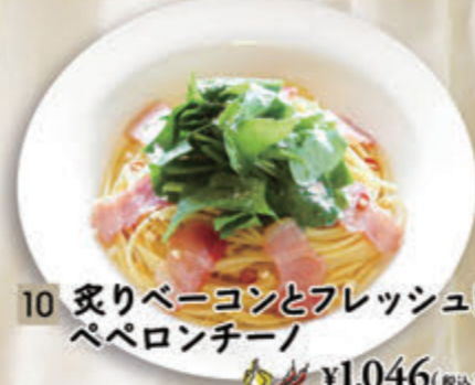
10 炙りベーコンとフレッシュ野菜の ペペロンチーノ ¥1,046(税込¥1,150)