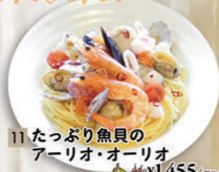
11 たっぶり魚貝の アーリオ・オーリオ ¥1,455(税込¥1,600)