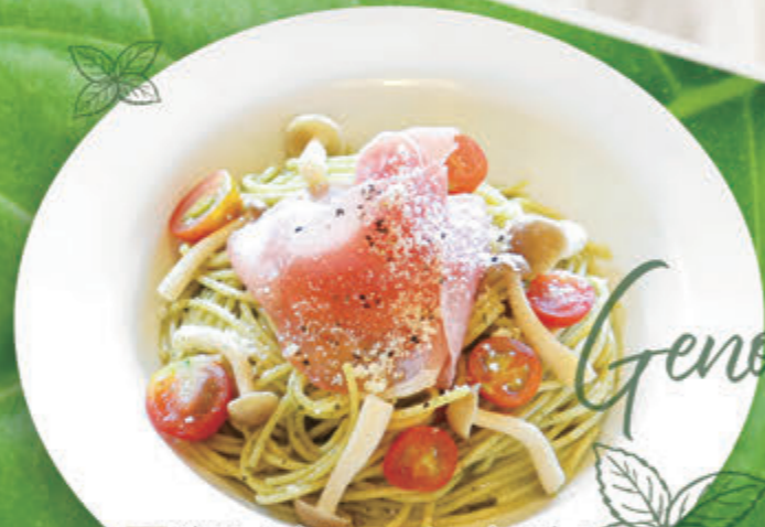
12 生ハムとフレッシュトマトの ジェノベーゼ ¥1,273(税込¥1,400)